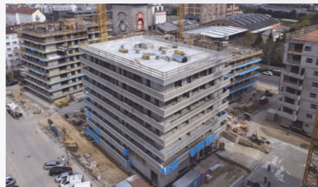
Wohnbau Preyersche Höfe, Wien 10