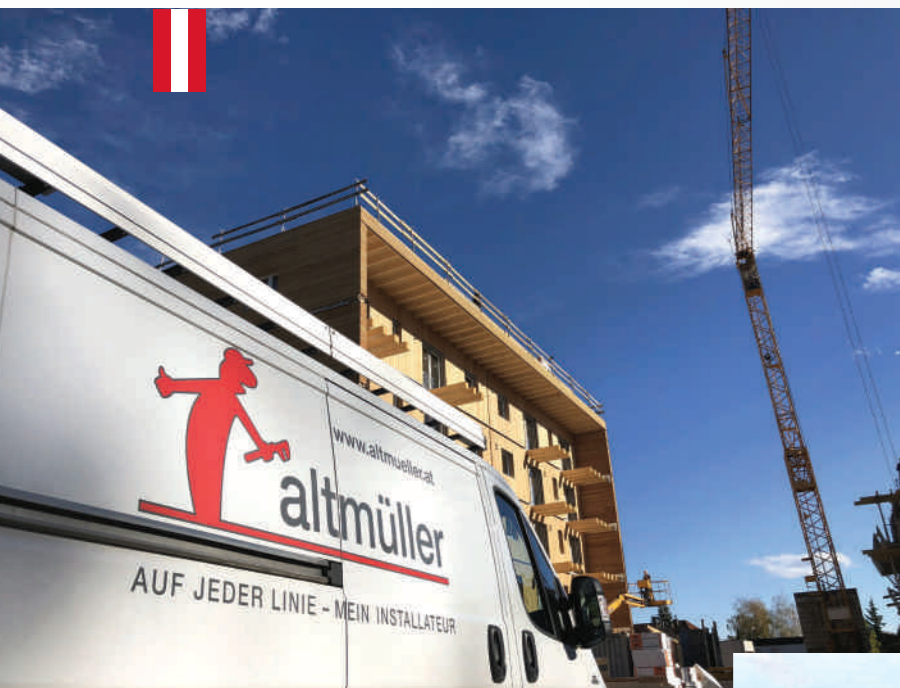
Holz-Wohnbau in Hörsching, OÖ

Nur allerhöchste Qualität und Präzision im Entwurf, Planung und Detailausführung führen zu einer attraktiven und hohen Wohnqualität mit nachhaltigen Werten. Unsere intelligente Kombination innovativer, moderner Haustechnik und optimaler Integration von selektierten Qualitätskomponenten mit der Gebäudehülle erschließt erst das große Potenzial bei der Verbesserung der Energiebilanz im mehrgeschossigen Wohnbau.