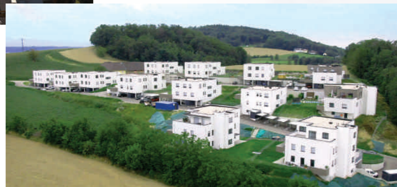
Wohnbau Luftenberg, OÖ