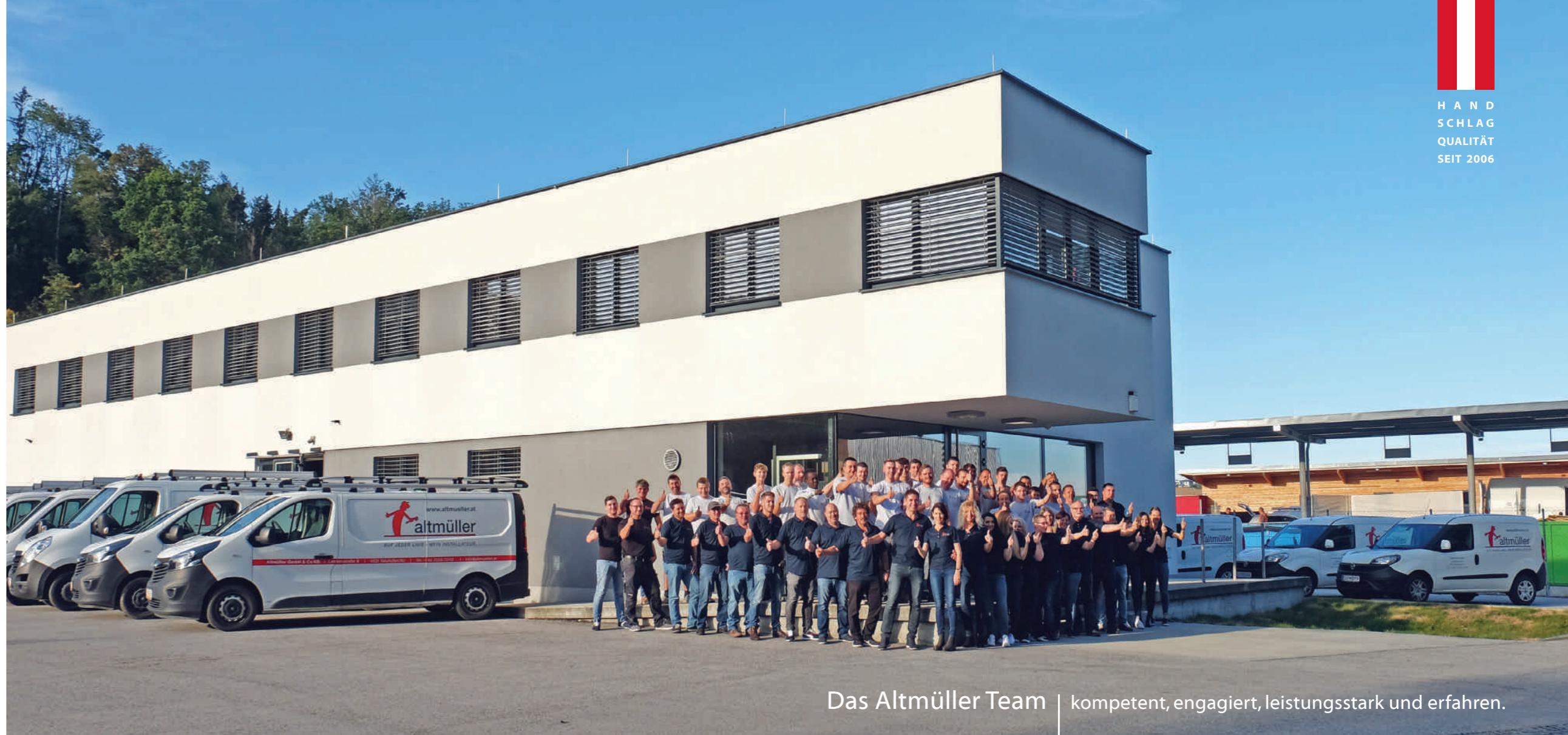
Das Altmüller Team | kompetent, engagiert, leistungsstark und erfahren.